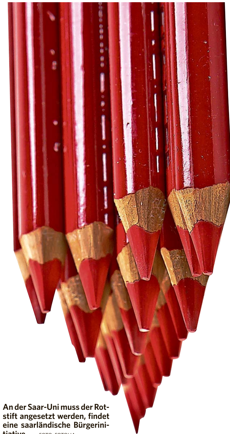
An der Saar-Uni muss der Rotstift angesetzt werden, findet eine saarländische Bürgerinitiative.